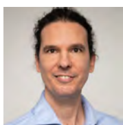
C.F. Müller Verlag Sven Hübler

Eine erfolgreiche Vorbereitung und einen gelingenden Start!